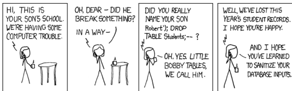
FIGURE 2 – xkcd « bobby tables »

Sachant que les commentaires sql s'obtiennent via -- et que le point virgule permet de séparer deux instructions, utiliser le programme précédent avec des entrées bien choisies pour détruire la base de données.